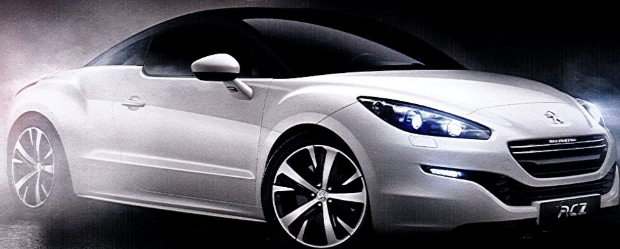
Abb. enthält Sonderausstattung. Kraftstoffverbrauch in l/100 km: innerorts 8,9; außerorts 5,1; kombiniert 6,4; PEUGEOT EMPFIEHLT TOTAL CO 2 -Emission (kombiniert) in g/km: 149. Nach amtlichem Messverfahren in der jeweils gültigen Fassung.