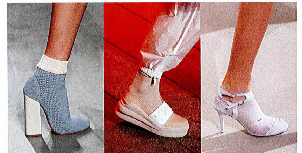
- VÉRONIQUE LEROY -

Sportlich oder sexy? Söckchen aus Hightech-Stoffen verschmelzen mit ihrer Sohle zum It-Accessoire: Sockshoes