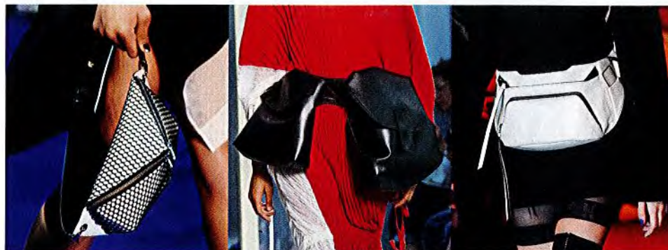
- MUGLER -