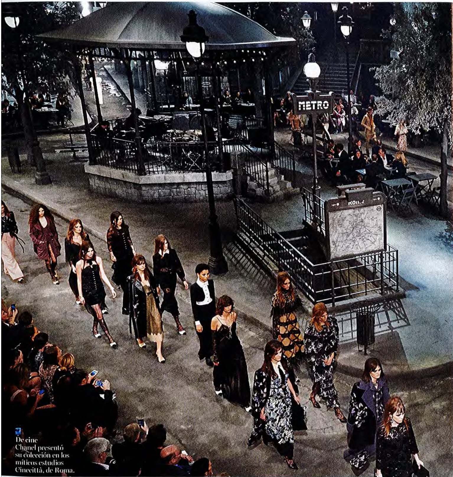
De cine Chanel presentó su colección en los míticos estudios Cinecittà, de Roma.