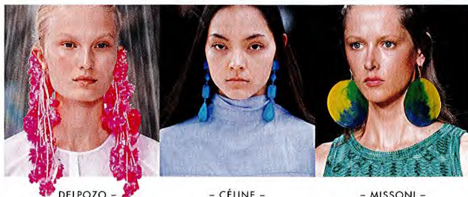
DELPOZO – – CÉLINE – – MISSONI –

HÄNGENDE GÄRTEN Überdimensionale Chandeliers in Signalfarben wirken wie Verstärker für Monochrom-Looks