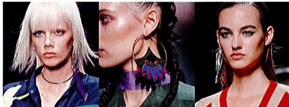
– VERSACE – – EMPORIO ARMANI – – BALMAIN –

KUNST AM OHR Bis zur Schulter und gern auch darüber: Mono-Hänger werden zu raffinierten Mobiles – Calder lässt grüßen!