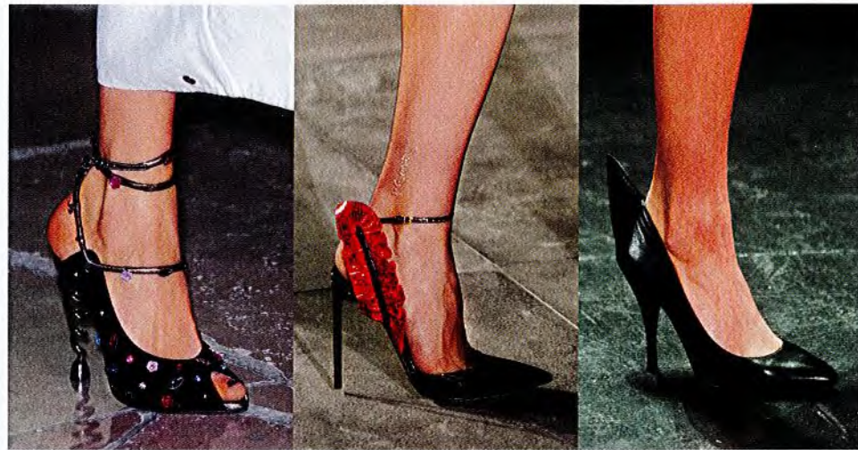
- KENZO -

Spitz, hoch und gefährlich sexy: Pumps sind die Geheimwaffe des 80er-Looks. So hot, dass die Funken sprühen!