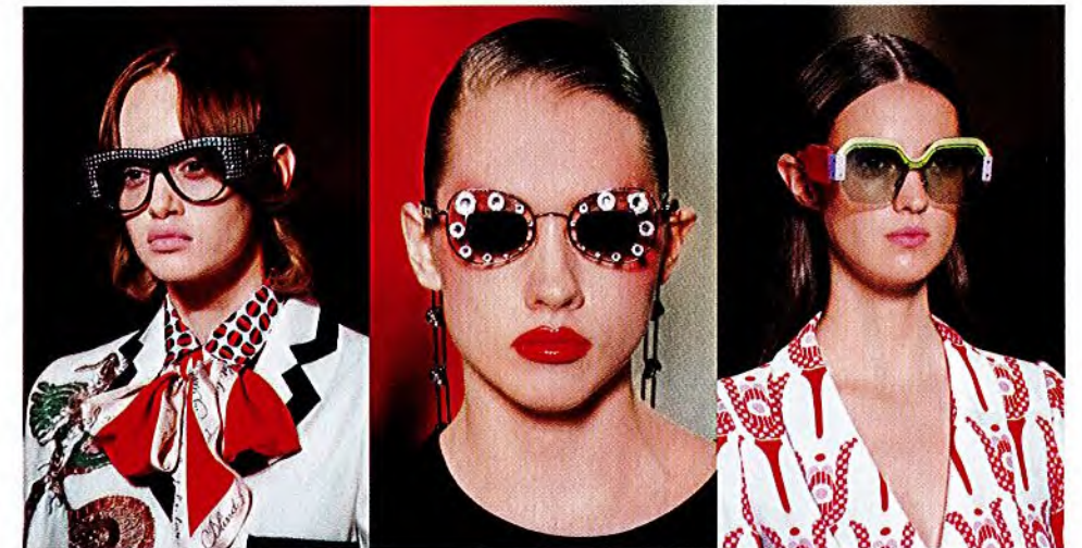
- GUCCI -

ZIGGY STARDUST Groß, schrill, bunt, zackig... Sonnen- brillen sind jetzt so verrückt, als ent- stammten sie Elton Johns Schatzkiste