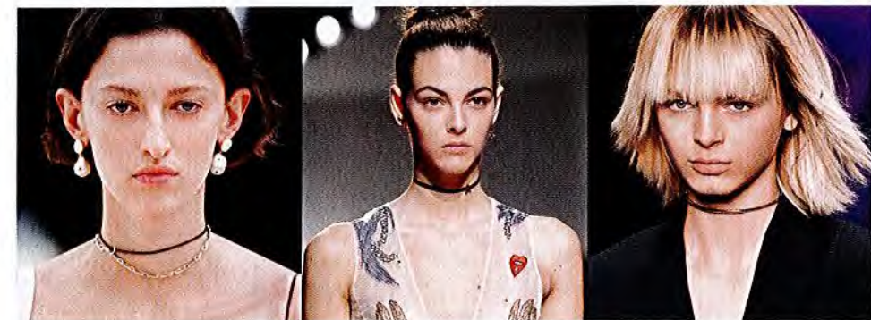
– CÉLINE – – DIOR – – VERSACE –

WAG-HALSIG Choker werden zu funkelnden XXL-Statements. Nur in Gold, und so glitzernd wie möglich!