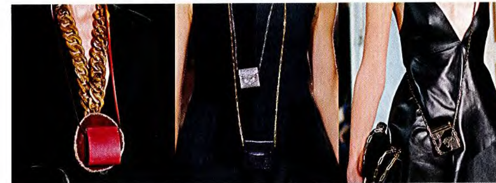
- GIVENCHY -

Dickste Freunde: Daily-Bags aus Glattleder, uni-farben und so riesig, dass sie locker als Weekender durchgehen könnten