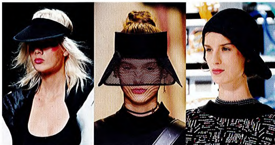
- MAX MARA -

Streetstyles wie Baseballkappe und Schirmmütze wer- den schwarz und glitzernd zu High- Fashion-Spielern