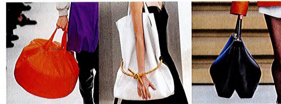
- BALENCIAGA -