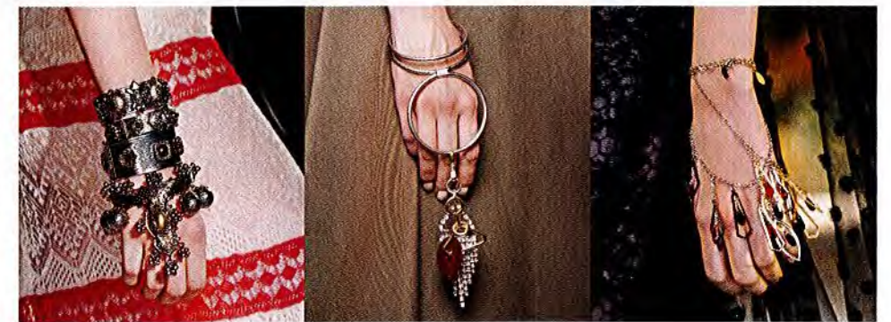
– ALEXANDER MCQUEEN – – MULBERRY – – RODARTE –

HAND ARBEIT Ob indisch verspielt oder keltisch wuchtig – diese Armbänder schmiegen sich über die Hand und werden so zum Ring-Ersatz