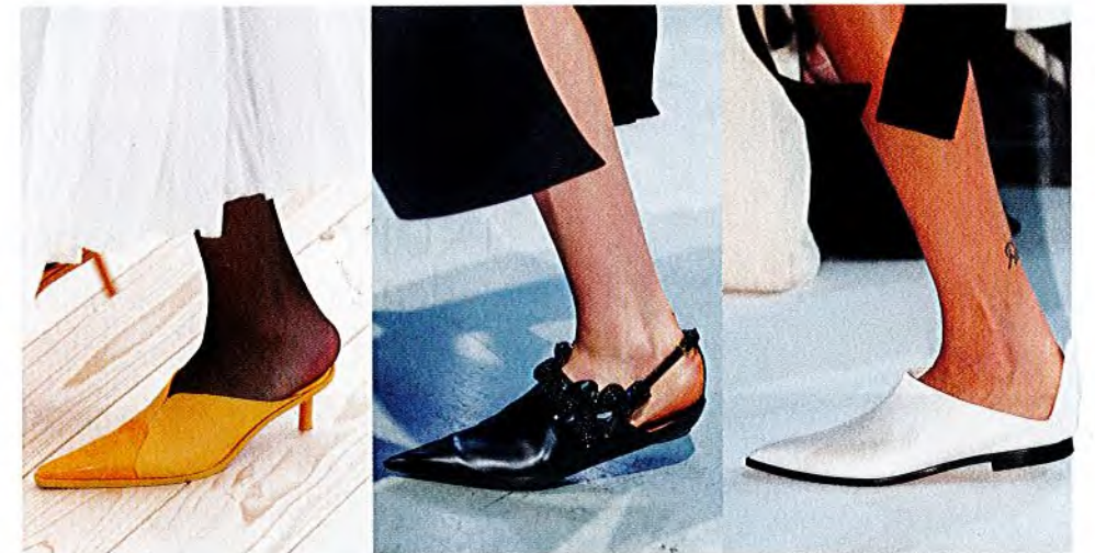
- CÉLINE -

Spitz, (fast) flach, unifarben, cool: die neuen Mules kehren in ihrer Form zu den nordafrikanischen Wurzeln zurück