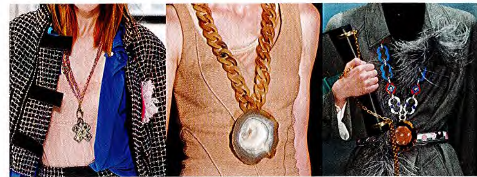
– CHANEL – – GIVENCHY – – PRADA –

SAUTOIRS ... heißen Ketten, die bis zum Bauchnabel reichen. Mit Anhängern aus Stein oder Bakelit beamen sie uns in die Hippie-Ära