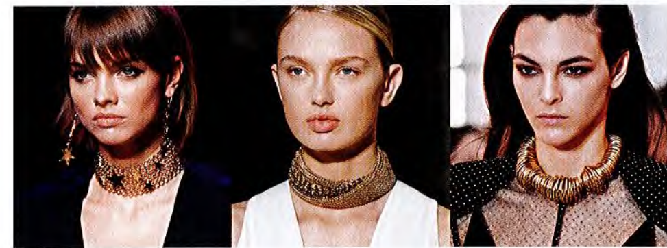
– ELIE SAAB – – LANVIN – – LOUIS VUITTON –

WAG-HALSIG Choker werden zu funkelnden XXL-Statements. Nur in Gold, und so glitzernd wie möglich!