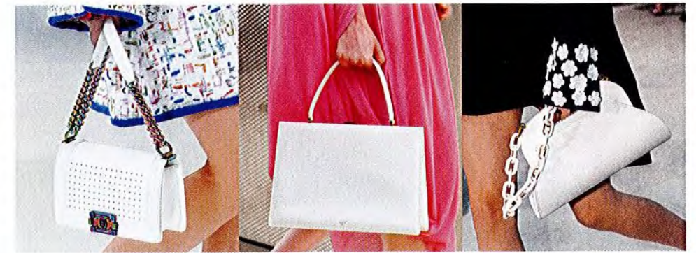
- CHANEL -

Jackie Kennedy hat es vorgemacht: Weiße Lack-Henkel-taschen passen zu allem. Und am besten zum flatternden Minikleid