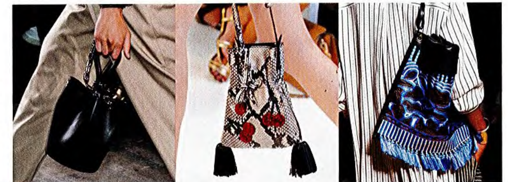
- ALEXANDER WANG -

Aus Brokat, Teppich oder derbem Leder, mit Bommeln, Fransen und Stickereien verziert ... So flirtet Beutel mit dem Orient