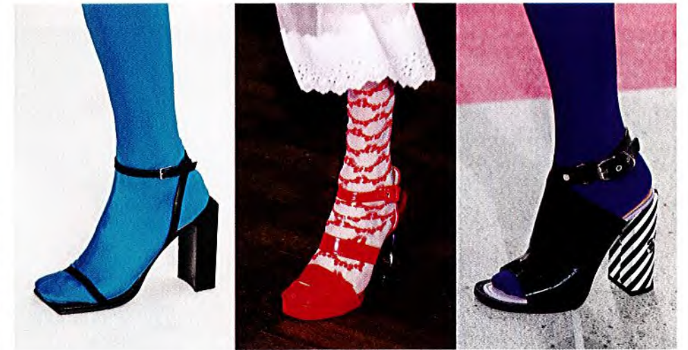
- BALENCIAGA -

LANG- STRUMPF Crazy Colours über- all – ohne bunte Nylons an den Bei- nen läuft diesen Sommer gar nichts