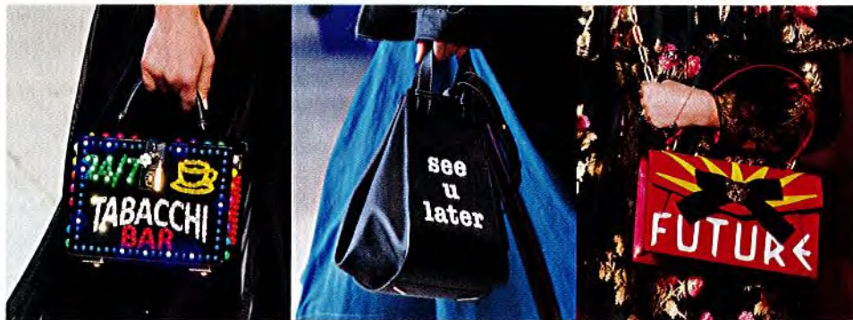
- DOLCE & GABBANA -

Alle, die online noch nicht genug gechattet haben, können jetzt ihre Message auch in die Welt hinaus tragen