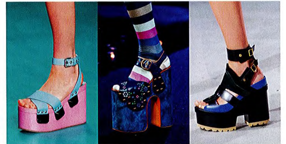
- MIU MIU -

Ultrahohe Psychedelic-Plateaus sind die perfekten Begleiter für den Seventies-Trip zu Ziggy Stardust