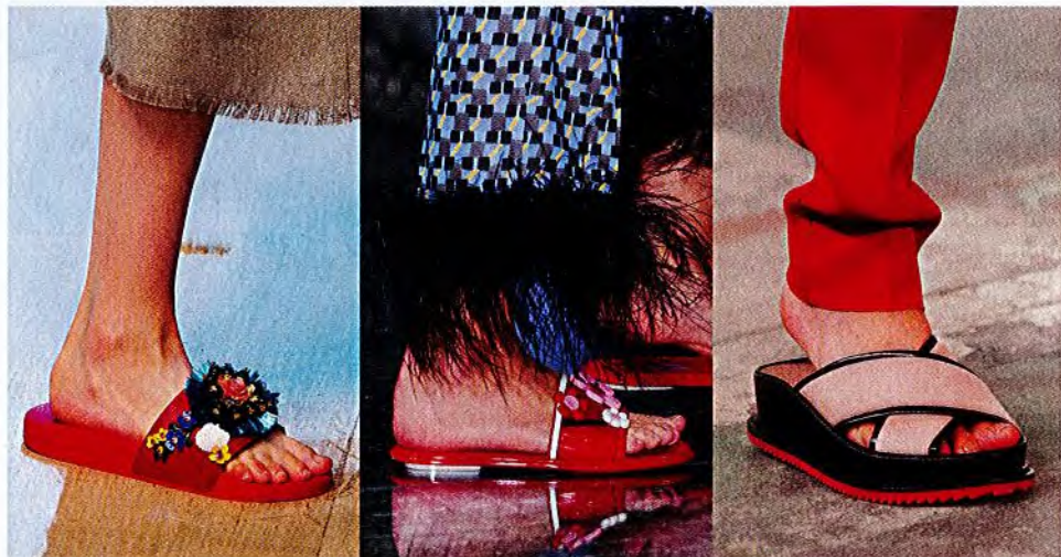
- DOLCE & GABBANA -

Bunt, gelackt und mit Plateau: Badeschlappen sind DAS Keypiece des Sommers. Fürs Freibad viel zu schade!