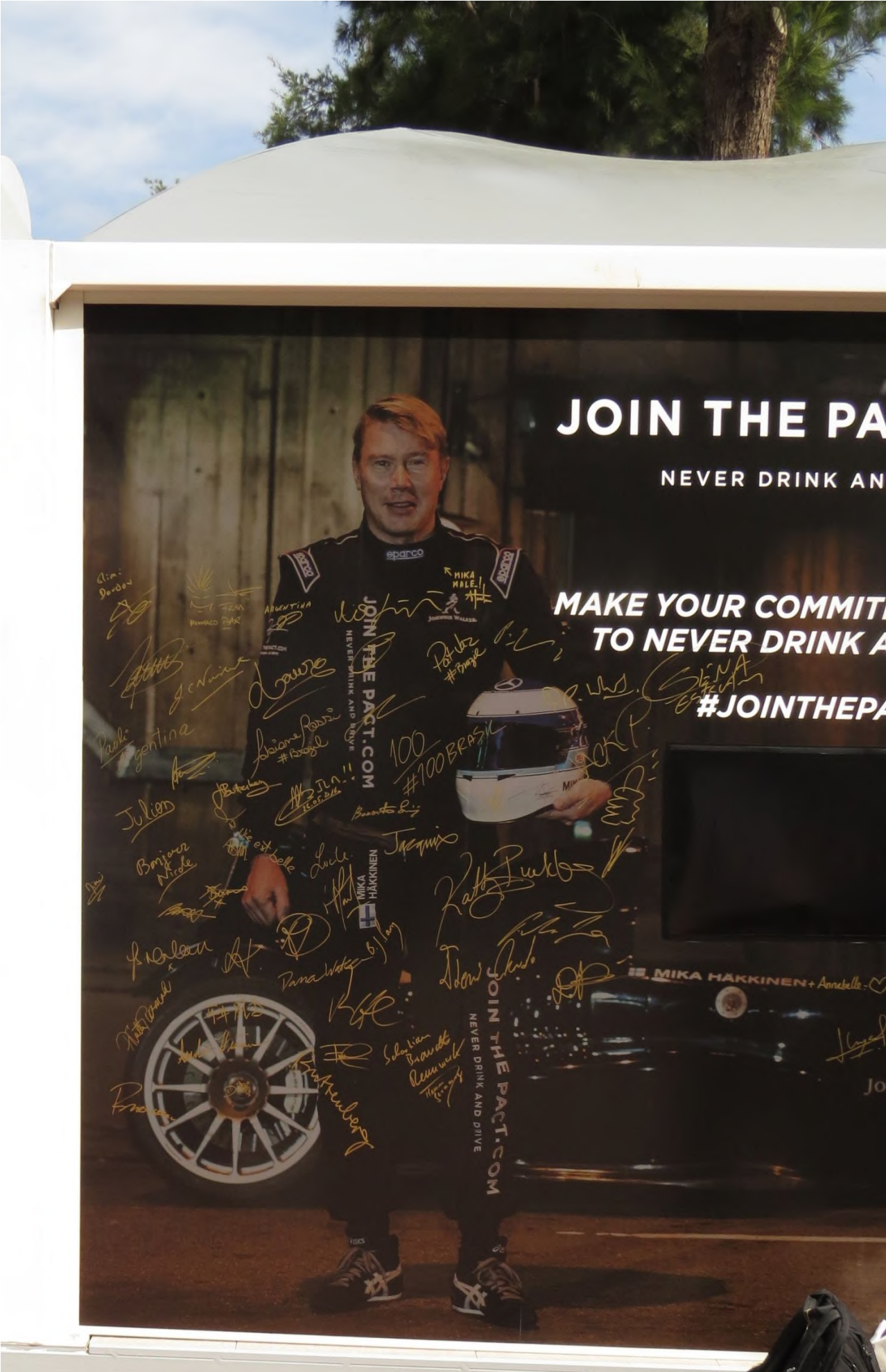
Mika Häkkinen (Formel 1-Weltmeister mit McLaren-Mercedes 1998/9)