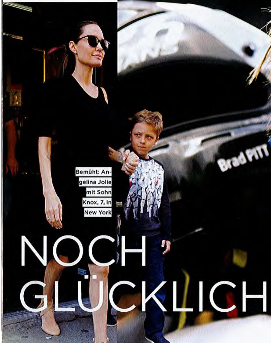
Bemüht: An- gelina Jolie mit Sohn Knox, 7, in New York

Hollywood-Film Ford : Ferrari 1966/7/8 2016