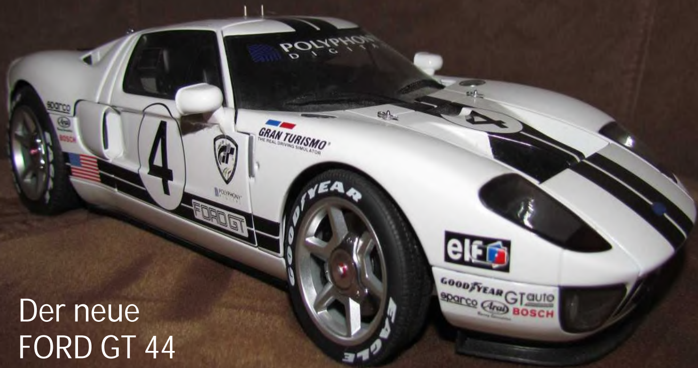
Der neue FORD GT 44